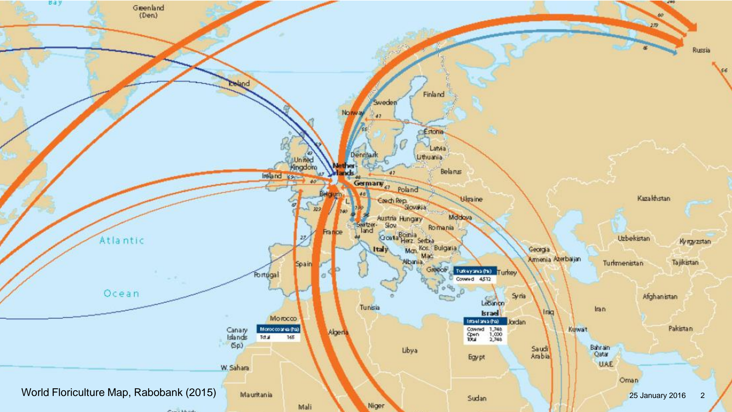
World Floriculture Map, Rabobank (2015)